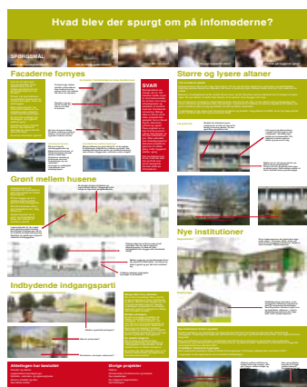
statements & udstillinger i bebyggelsen