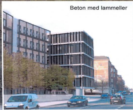
Beton med lammeller

IFV: "IFV har drøftet de fremlagte gode forslag i såvel ledergruppe som en brugergruppe af medarbejderrepræsentanter. Alle er enige om at det første forslag med murstensbånd og vinduespartier med mørk karm er den foretrukne løsning. Den fremstår enkel og i god harmoni med de eksisterende bygninger. Løsningsforslaget med et panel-hus finder vi stikker for meget ud fra de øvrige bygninger ved Rolighedsvej og det grønne hus frygter vi giver for stort vedligehold. Hvis sidstnævnte kommer til at se trist ud, giver det et meget dårligt omdømme i nærmiljøet og den risiko ønsker vi ikke. På baggrund af ovennævnte ønsker IFV at der arbejdes videre med murstenshuset. Brugergruppen har påpeget at det ikke er hensigtsmæssigt, at der er vinduespartier fra gulv til loft, hvor kontorerne er fuldt synlige udefra. Medarbejderne ønsker at den nederste del af kontorerne er ikke er synlige udefra. Dermed undgår man følelsen af at *være overvåget*. Det behøver ikke at være et bredere murstensbånd i bygningen, men kan ske ved at overføre udtrykket fra den eksisterende bygning med sorte plader eller blænde vinduespartierne i den nederste del. Man ønsker 2 vinduer der kan åbnes i hvert vinduesparti, med stop eller hapse, så det er let at tilpasse udluftning til vindforhold uden for."